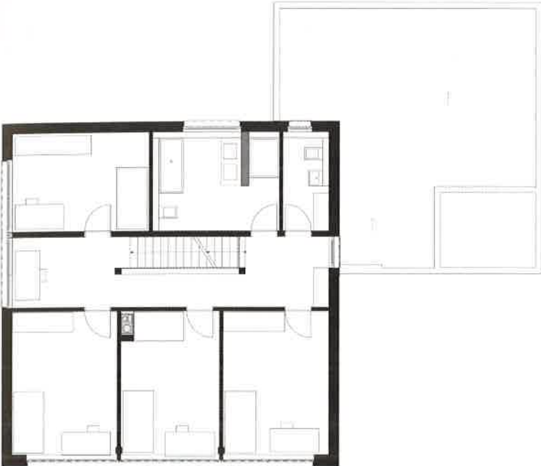
left: Dining area_Living room, right: Top floor plan_Garden view_Living area_Stairs. links: Essbereich_Wohnraum, rechts: Grundriss OG_Gartenansicht_Wohnbereich_Treppe. gauche: Salle à manger_Séjour, droite: Plan niveau 1_Vue du jardin_Séjour_Escalier.